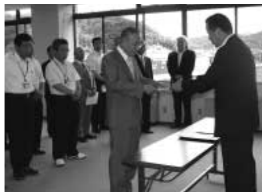
辞令交付を受ける遠藤会長 (7月2日：法勝寺庁舎)

現在、日本全国のさまざまな地域で、少子高齢化や都市部への人口流出、国と地方の危機的な財政状況、生活圏と経済圏の拡大などにより、地域社会を取り巻く環境に変化が起こり、地域や地方自治体が抱える課題は高度多様化しています。 このような中、南部町では、「住民」「地域」「行政」が相互に繋がりをあい、相乗効果によって地域社会を強化・育成するための母体づくりを提唱してきました。町内をいくつかの区域に分け、「地域振興協議会」の構築を想定して、まちづくりアンケート、地域づくり懇談会などを行い地域の意見を集めました。 平成17年11月には諮問機関を設置して区域割りを検討し、現在の7地区の区域割りを町の方針として決定しました。その後、それぞれの地域で地域振興協議会の構築が話し合わせられ、平成19年3月に「南部町地域振興区の設置等に関する条例」が制定されると、同年4月15日の南さいはく地域振興協議会の発足を皮切りに、7月8日まで に7地区全てに地域振興協議会が誕生しました。 協議会の会長・副会長は町の非常勤特別職として位置づけられ、会長・副会長に、南部町長から任命の辞令が手渡されました。 同時に、地域ごとの福祉・保健の課題の発見・解決のため地区ごとに担当保健師が任命されました。また、協議会が自主的な自治活動を行い、独自の地域づくりができるよう、行政の財政支援として支援交付金制度が創設されました。 今後は協議会による地域の活性化が期待されますが、活性化は役員任せでは実現できません。みなさんも話し合いの輪に参加してください。