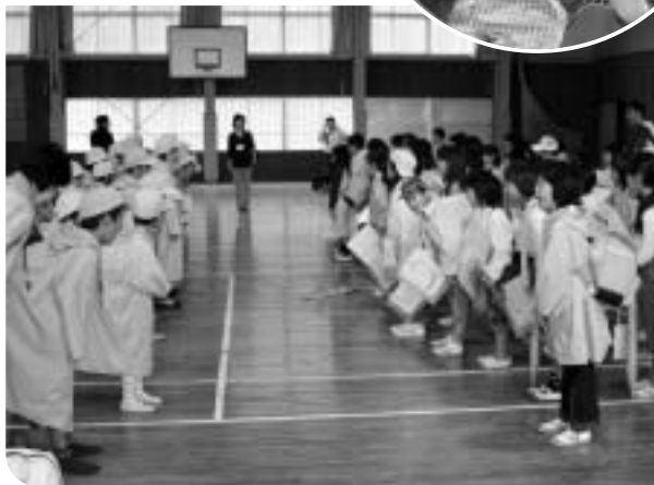
みんな元気な声でごあいさつ

新しく誕生した南部町を、よく知り同じ町の同級生同士仲良くなるために、西伯小学校・会見小学校・会見第二小学校の二年生（合計一九名）が、十月八日・十二日の両日「南部町たんけん」と題してお互いの学校に招待しあい、交流を行いました。 初日は、あいにくの雨の中、西伯小学校で初対面。緊張した面持ちでしたが、元気な声であいさつをかわし、十九班にわかれて法勝寺の町を「たんけん」に出かけました。