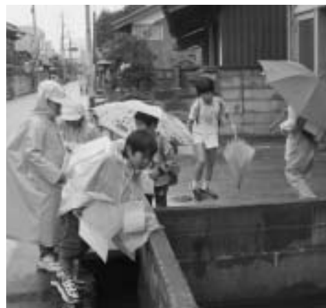
大きなコイがいるぞ

案内する場所は西伯小学校の二年生が考え、役場や牛小屋などおよそ一時間かけ「たんけん」を楽しみました。