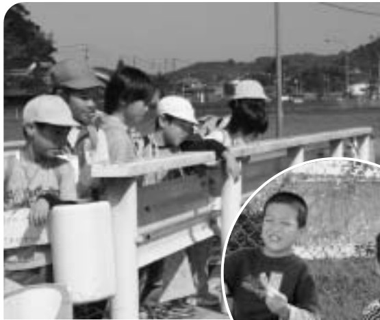
ここがホテルの名所だよ