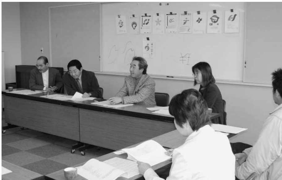
アンケート結果の説明を受ける委員

ルな気持ちを抱き、心豊かな町を表現。オレンジは太陽・柿、ピンクは豊かな気持ち・安心感・桜、青は澄み切った空・緑水湖を表している」です。アンケート結果からもわかるように、みんなで選んだ町章です。未来に向かって協力し、心豊かな町づくりの原点となる町章にしましょう。