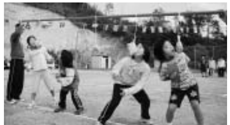
なかなかうまくいかないな~地区運動会~