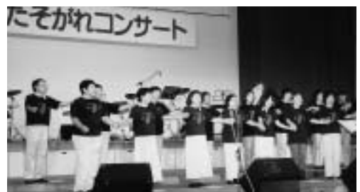
13回を数えた、たそがれコンサート