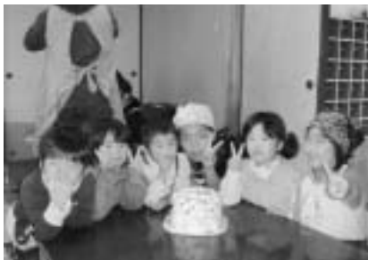
上手に出来た！イエイ！ ～クリスマス会～

東西町地区公民館では、公民館祭、夏祭り、運動会等の事業をはじめ、各種同好会（十九団体）が活発に活動しています。より地域に密着した事業活動に心がけ、公民館が地域での活動拠点となり、心