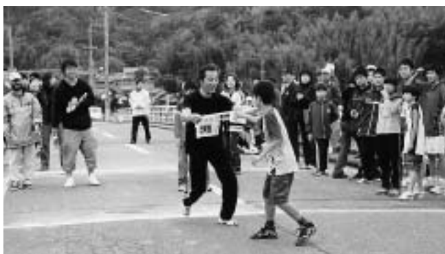
たくさんの声援を受け力走。天津駅伝大会