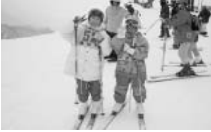
寒さなかへっちゃんら ~上長田スキー教室~

今後の活動としては公民館が中心となつて他団体と協力しながら行事を進めていく必要があると考えております。