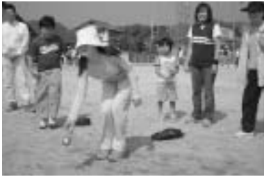
気持ちを込めて、エイ！ ～ペタンク大会～

活動では、ペタンク大会・グラウンドゴルフ大会・地区運動会・文化祭・ソフトバレー大会・芸能大会、そして年四回各集落に声をかけて行う公民館周辺の清掃奉仕があります。特にペタンクは老若男女、気楽にできるため年々参加者が増え、将来は町の大会にまで発展させたいと願っています。また、芸能大会や文化祭では、地区の皆さんの「芸」に毎年感動し、感心し、そして心のそこから笑わせていただいています。