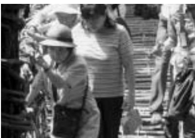
徳島県かずら橋~ひょうしぎ学級~