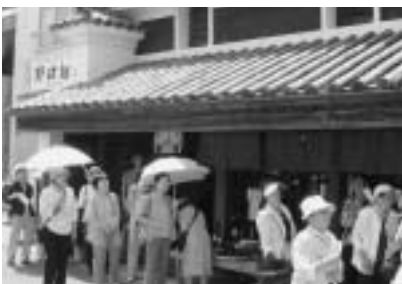
うだつで有名な徳島県脇町~ひょうしぎ学級~

なかでも、あいま公民館では女性教育の一環としてひょうしぎ学級があります。五〇歳以上の女性で構成されているこの学級は、女性の地位向上、学習機会の提供を目的として始まりました。現在の学級生は一一〇人、健康・教養講座や料理教室、陶芸教室、日帰り研修(本年は徳島県)など年間十二回の学習活動を行っています。ある学級生の方が、「活動を通して自身の研修を積めるのと共に、多くの友人を作れるのが最大の楽しみ」と言われました。学びたい女性はいつでも大歓迎! 私たちと一緒に学びませんか