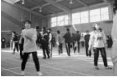
和気あいあい ～ソフトバレー大会～