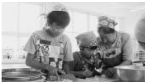
夏休み子ども公民館教室体験入学～鶴寿大学料理教室～

「総合的な社会教育センター」として、町民のみならず「愛される公民館」として取り組んでまいります。さいはく公民館では、現在四十以上の教室・講座・グループが学習活動をしています。書道、社交ダンス、コーラス、絵画、着物着付け、菊づくり、パソコン等々の教室や鶴寿大学（高齢者学級）の皆さんが、教養、娯楽、レクリエーションを通して仲間づくりを進め、生涯学習や交流の拠点として健康づくりや生きがいづくりの場として利用していただいています。