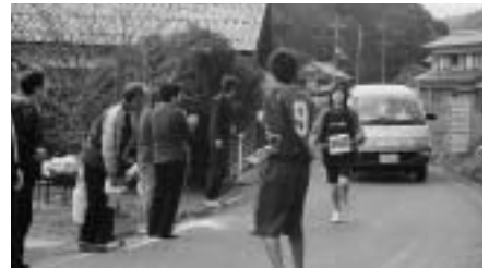
ガンバレ！ガンバレ！～じげ巡り駅伝大会～