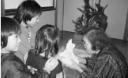
つきたての餅を高齢者の家庭に配ります。~年末福祉餅つき大会~