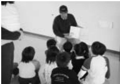
おじさんの絵本の読み聞かせにじっと見入る ～クリスマス会～

今後は、思い切り自由に遊べる「子ども遊びの森」づくりや子ども達だけで企画・実行する行事も行いたいと考えています。