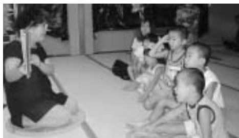
たくさん子どもたちが集まりました～絵本のおはなし公民館～

さいはく公民館では、参加・体験・実践を通してあらゆる年代の住民参加をすすめ、生きがいと健康づくりそして、交流の場として地区公民館や各種団体との連携を深め、「地域活動の拠点」、「町民二