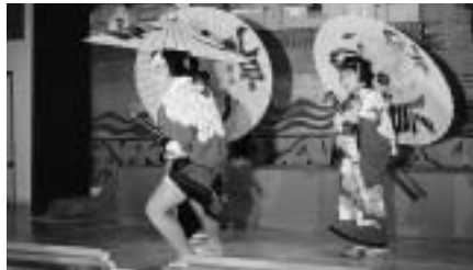
子ども歌舞伎の勇姿～カラオケ芸能大会～

今後も各自治会とさいはく公民館のご協力を得ながら公民館としての組織づくりに努め活動を推進していきたいと思っています。