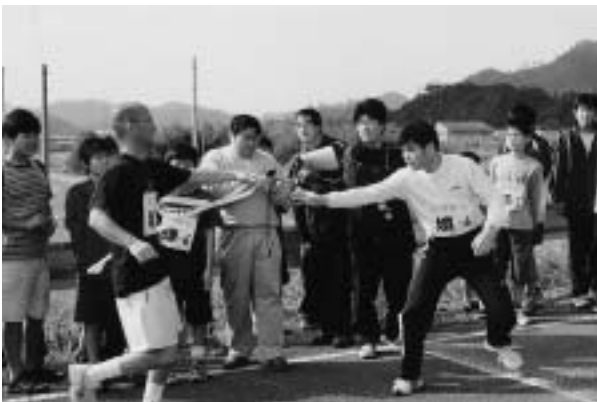
次、たのむぞ！～昨年の天津駅伝より～

十一月と二月に『館報あまづ』の発行予定です。今後いろいろな行事を通して、ふれあいと連携を深めていきたいと思いたします。皆様のご参加・ご協力をお願いいたします。