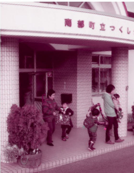
退園時間頃(つくし保育園)

は保育料を引き下げることは考えておりませんが、その後のいろいろな町村の状況なども検討した結果