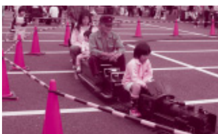
南さいはく振興協議会「かまくらふれあい祭」

現在、各地域振興協議会では、地域づくり計画の策定や二年度に計画した独自の取り組みがようやく始まつてきているように感じています。今後の協議会の共通した取り組みとしては、地域づくり計画の策定が柱の一つです。