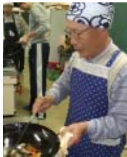
落ち着いてできました。

今まで使ったことのない大きな中華鍋の扱いに、文字どおり手をやきながら鍋返しにも挑戦しました。