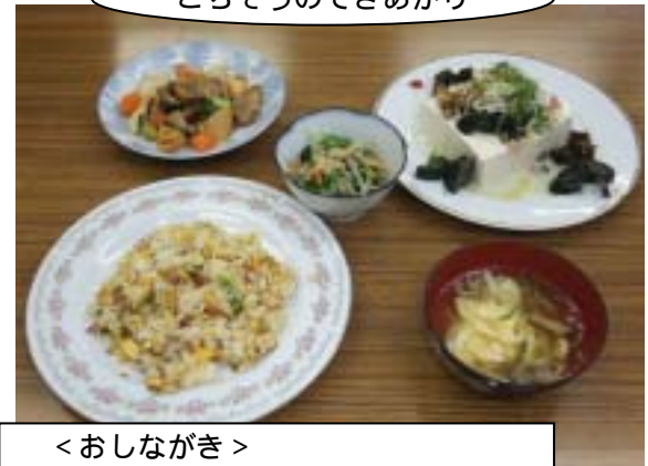
ごちそうのできあがり