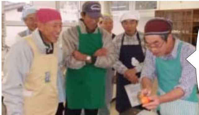
細田ふれあい部員