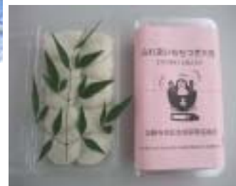
お配りした「おもち」