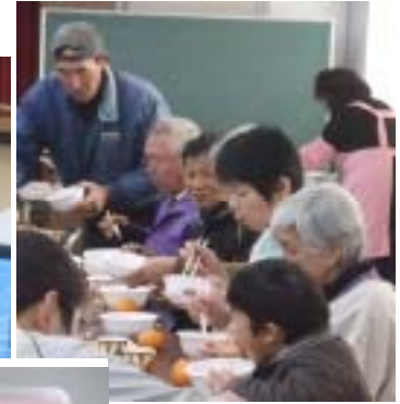
おいしくて つい食べ過ぎてしまいます。