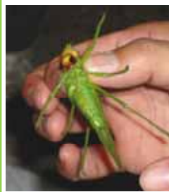
今回一番の大物でした。

法勝寺川河川敷で夜空の観察 を予定していましたが、あいにくの空 模様のため、昆虫観察をしました。 短時間でしたが、とても多くの虫に 出会えました。これからの季節は虫 の音を耳にする機会が多くなりま す。どんな虫か気にしてみたいか がでしょうか。