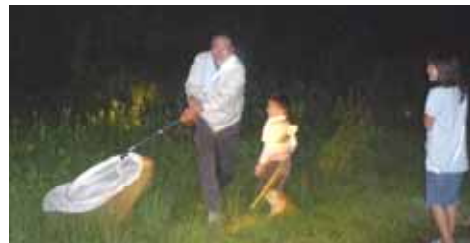
スウィーピングという方法で草むらの虫を捕まえます。

法勝寺川河川敷で夜空の観察 を予定していましたが、あいにくの空 模様のため、昆虫観察をしました。 短時間でしたが、とても多くの虫に 出会えました。これからの季節は虫 の音を耳にする機会が多くなりま す。どんな虫か気にしてみたいか がでしょうか。