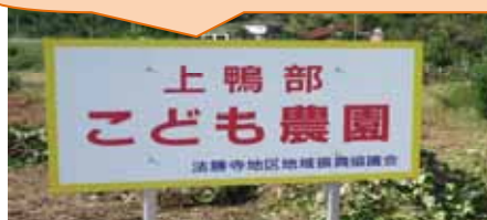
上鴨部 こども農園

6月に植えたイモ苗が大きくなり、収穫の時期を迎えました。10月10日(土)に上鴨部の小さな子どもたちが大勢集まって地区のみなさんといっしょにイモを掘って運びました。収穫したイモはみんなに配り、各家で食べてもらいました。