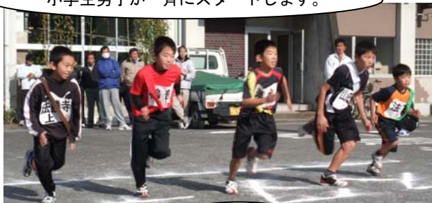
あとはまかした → まかせとけ!