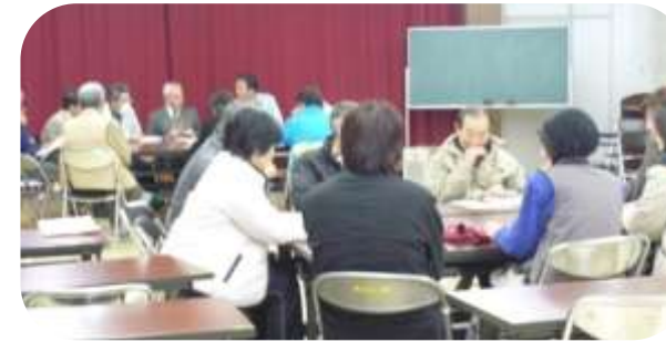
3つの班にわかれて意見交換しました。

平成22年2月5日(金) 南部町公民館さいはく分館 人権学習推進委員会を中心とした27名で人権問題についての交流懇談会が行われました。教育委員会専門員さんのお話の後3つの班にわかれて意見交換が行われ、問題点や地域で取り組むべきことなど、活発な意見がたくさん出ていました。 人権意識の高い、差別解消がきちんとできているまちづくりをめざし、「受け身」ではなく「みんなでやっていくこと」が大切であると再認識できた会となりました。