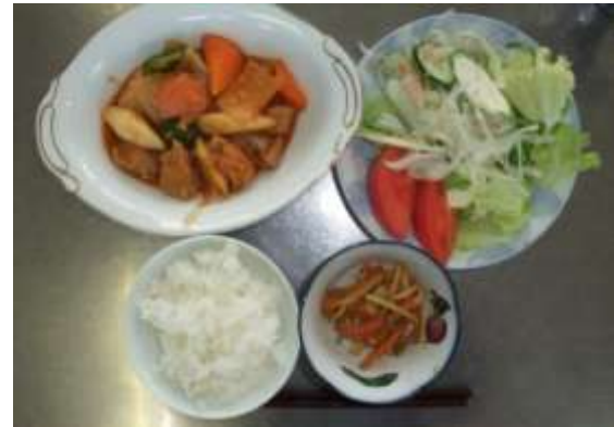
ノンオイルの青じそドレッシングに少しだけカレー粉を入れるとまた違った風味でおいしいですよ。

健康は毎日の食生活から! 食生活チェックをしてみましょう。(たくさん当てはまる人ほど要注意)