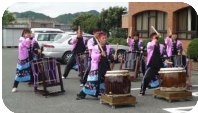
南部太鼓で賑やかに見送り