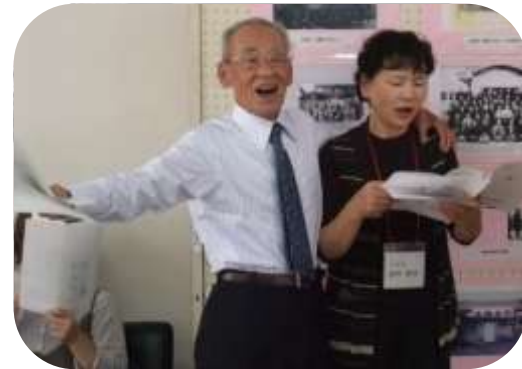
大きな声で歌いましょう♪♪