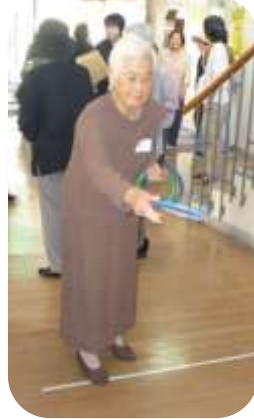
輪投げも人気でした