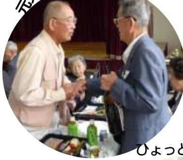
ひょっとこ踊りは盛り上がりましたね~。