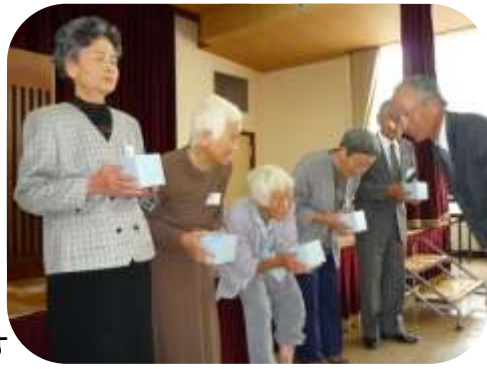
米寿のお祝いを受けられた皆さん