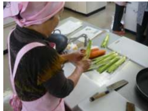
マコモタケの皮むきにもコツがあるようです。