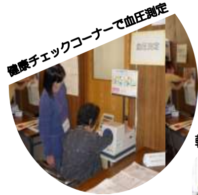
健康チェックコーナーで血圧測定