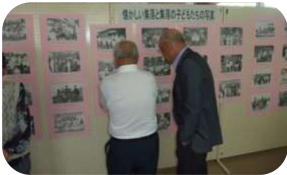
今年も好評だった写真展