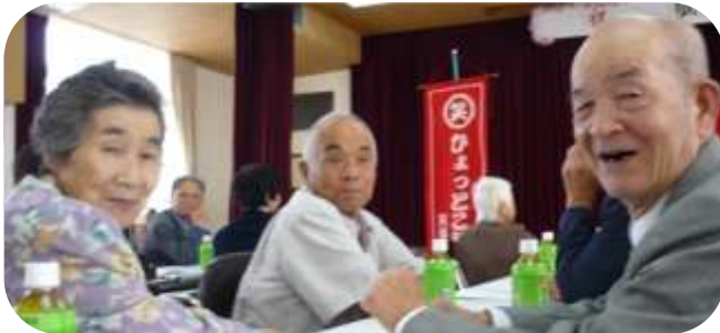
カメラ目線で「はい、チーズ」