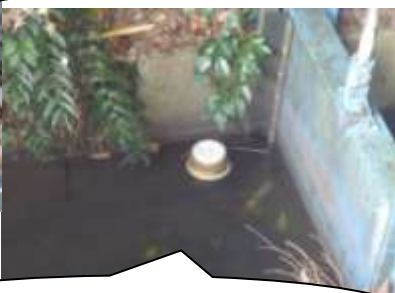
川に浮かぶインスタント麺のカップ