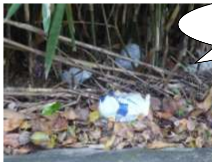
竹やぶにまぎれるように捨ててあったビール缶やナイロンごみ。

法勝寺地区内でもごみの不法投棄が後を絶ちません。右の写真は長田神社前の法勝寺川で見つけたごみの一部です。ビニール袋に入れたビールの空き缶・牛乳パック・発砲スチロールなど、家庭ごみが目立ちました。なぜ家で分別して出せないのでしょうか?家電製品などの大型ごみだけが不法投棄の対象ではありません。ひとりひとりがモラルを守り、ごみのないきれいな町づくりを心がけていきましょう。