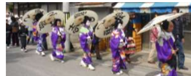
まつり2日目の10日は天気も良く、前日にも増して多くの人出がありました。子ども歌舞伎のお練りがあるなど、まつり気分も最高調な日曜日となりました。