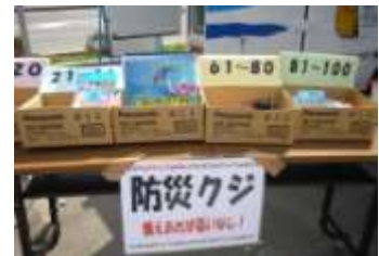
【防災クジ】 煙体験をされた方に、もれなく当たる防災グッズ。