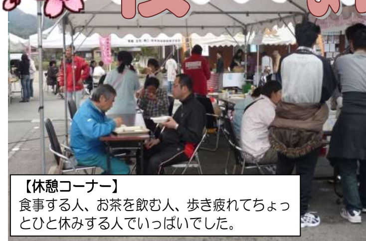
【休憩コーナー】 食事する人、お茶を飲む人、歩き疲れてちょっとひと休みする人でいっぱいでした。