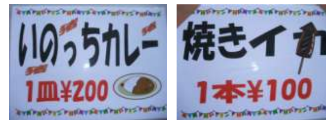
【猪カレー】(ふれあい部) 【焼きイカ】(総務企画部)

今年も法勝寺一式飾りに合わせ、盛大に桜まつりが開催されました。 天気にも恵まれ、法勝寺地区地域振興協議会のコーナーも大変な賑わいでした。