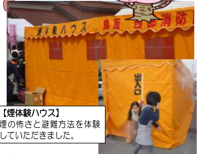
【煙体験ハウス】 煙の怖さと避難方法を体験していただきました。

今年も法勝寺一式飾りに合わせ、盛大に桜まつりが開催されました。 天気にも恵まれ、法勝寺地区地域振興協議会のコーナーも大変な賑わいでした。