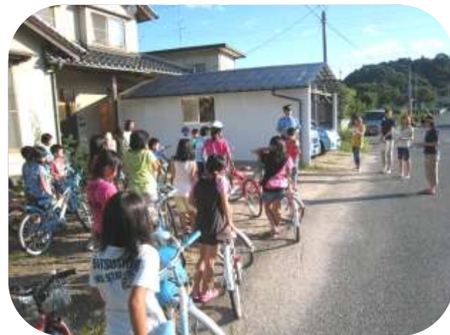
お巡りさんの話のあと、いざ実車！！

その日だけはラジオ体操を一緒にして終わってから講習です。 初めに駐在さんから自転車の安全な乗り方や鳥取県道路交通法の一部改正（傘差し運転の罰則等）の話をしてもらい保護者と一緒に自転車講習会をしました。（城山：N）