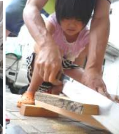
私だってやれるんだから～！ ちょっと怖いけど・・・