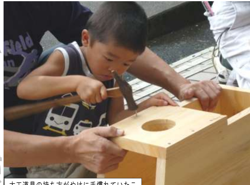
大工道具の持ち方がやけに手慣れていたこの2人・・・大工の遺伝子ウソつかない。「現場」が「遊び場」・・・なるほどね・・・