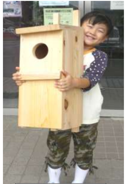
出来たよ～。満面の笑みがこぼれます！