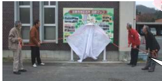
設置場所は協議会事務局(南部町公民館さいはく分館内)側の外壁です。是非ご覧ください。

法勝寺地区の名所旧跡を知り、足を運んでいただけるようパンフレットも作成しました。