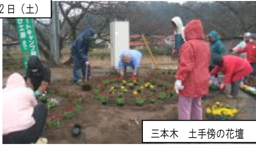
三本木 土手傍の花壇

いつも一緒に花植えをしてくれる子どもたちは雨のため今回は参加がありませんでしたが、どんな時も元気なおじちゃん・おばちゃんたちの力で花壇が整っていき、春を迎える準備が出来ました。きれいに咲くパンジーが、これから皆さんの目を楽しませてくれるでしょう。