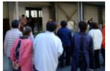
足元が悪い箇所・トイレの場所など確認しました。