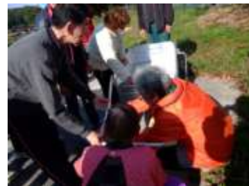
力を合わせてリヤカーを組み立てます。