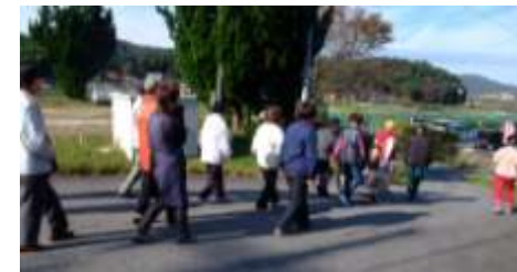
避難場所(中学校)までの経路を確認