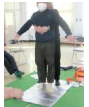
そのままジャンプします