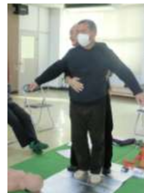
後ろから抱きかかえるようにします