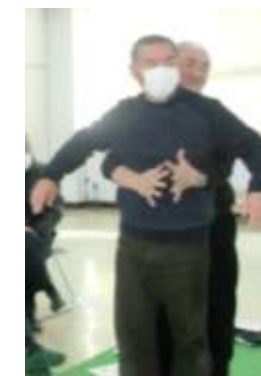
みぞおち部分に手をまわします