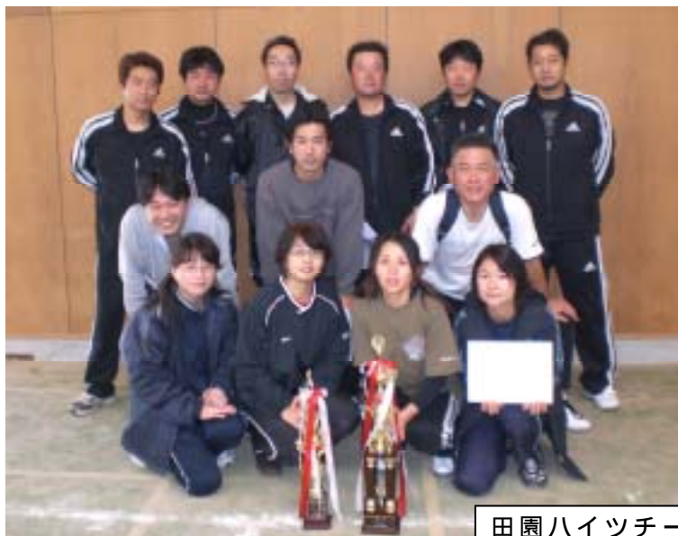
田園ハイツチームのみなさん