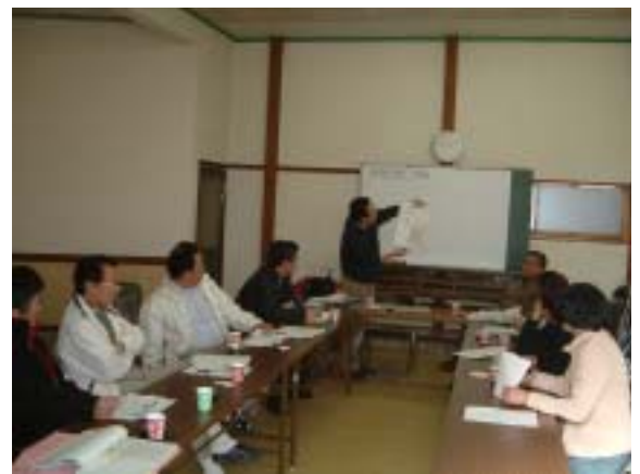
話し合いの様子（地域のためにみんなで考えます。）