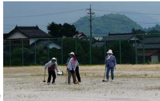
昨年度は延べ107名が利用