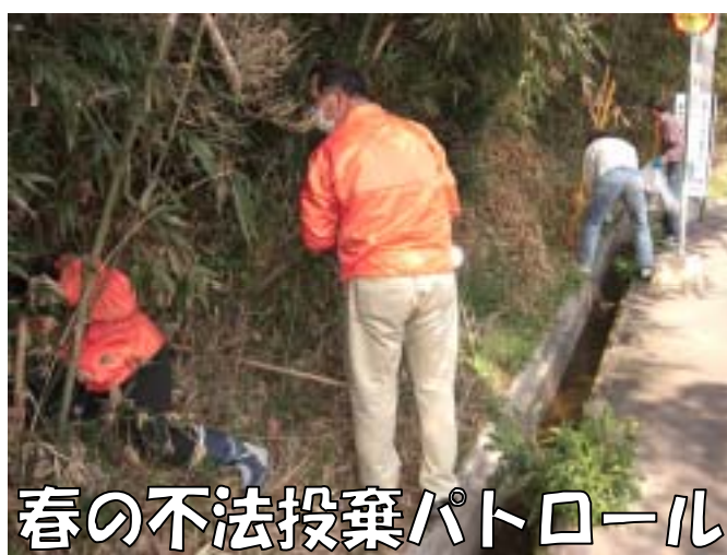
春の不法投棄パトロール