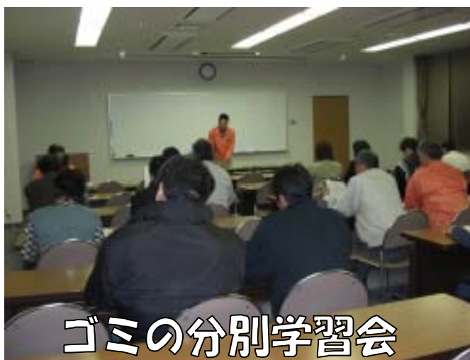
ゴミの分別学習会

地域のみんなが少しずつ取り組んでいけば、確実に地域はよくなります。今日からさっそく出来ることに取り組んでみましょう。