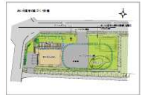
にぎわい交流拠点づくり構想