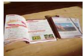
富有の里づくり計画書