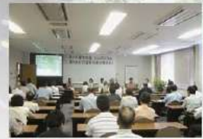
あいみ富有の里シンポジウム