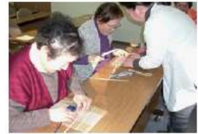
富有塾（機織り体験）