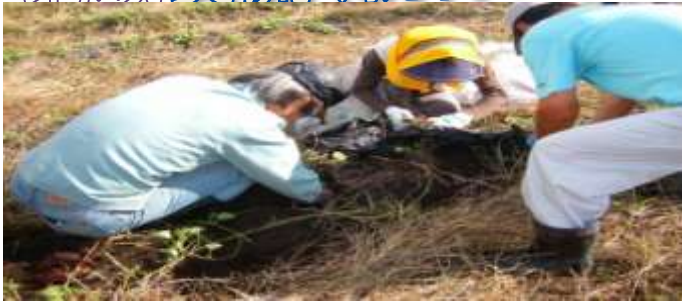
都市部交流事業の一環として、10月11日(祝・月)約50名の参加を得て、6月に植えたサツマイモの収穫をしました。当日は天候にも恵まれ参加者全員が汗をかきながら、約600kgを収穫し、いも煮で昼食をとり和やかに交流しました。(担当:総務企画部)