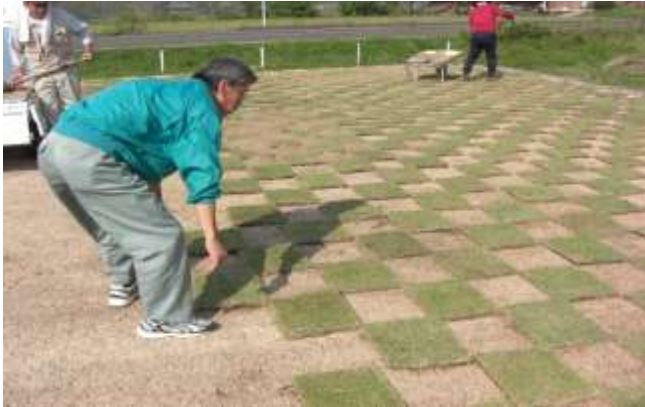
10月17日(日)えぶろん(地域活性化拠点施設)の広場全体に芝を植えました。