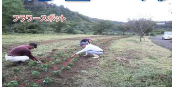
10月3日(日)朝鍋ダム近辺のフラワースポットで花壇づくりを行いました。当日は小雨の降る中、サルビア300本と菜の花の種子を蒔きました。一度見にお出かけください。(担当:地域づくり部)