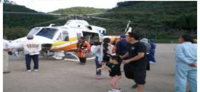
10月11日(祝・月)鳥取県西部地震から10年目の事業として、南部町防災フェスティバルが開催され、防災ヘリによる情報収集訓練、地震の揺れ、非常食の備え等を体験し、改めて地震の怖さと災害に対する備えを学びました。(O)