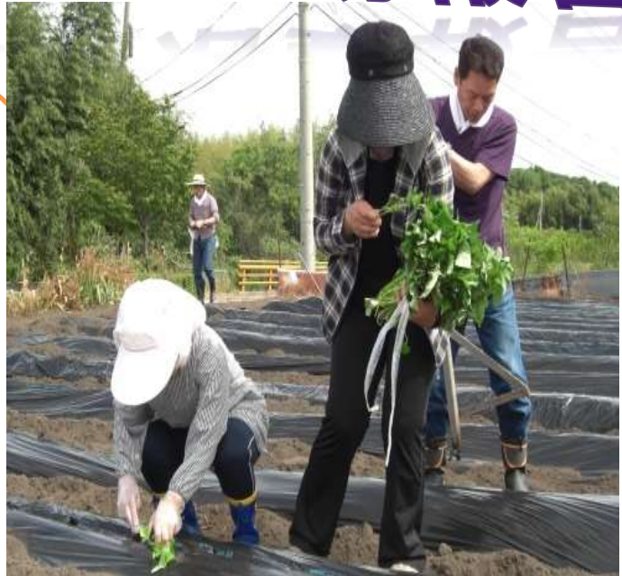
就将公民館と交流(サツマイモ植え)