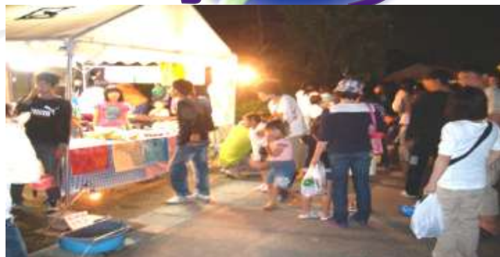
観賞者で賑わう金田附近