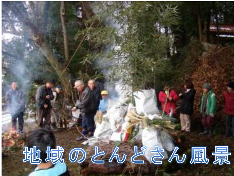
地域のとんどさん風景