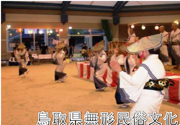
鳥取県無形民俗文化財指定の小松谷盆踊り