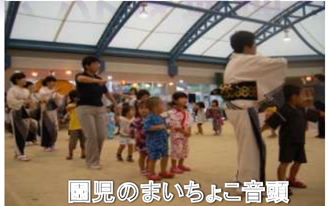
園児のまいちよこ音頭

今年は連日(20数日)酷暑で、記録的な少雨が続けていたが、当日は午後から雨模様となり、急遽「会見ドーム」に会場を変更して会見地区夏祭りを開催。 ビンゴゲームで豪華景品が当たり大歓声…。 踊りでは、保育園児の「まいちよこ音頭」・会見小音頭・ヒップホップダンス・鳥取県無形民俗文化財の「小松谷盆踊り」等があり、最後に参加者全員で総踊り。大景品抽選や焼きそば・カレーライス・アイスなどのバザーで、昨年以上の参加者があり賑やかに盛り上がった一夜でした。(生涯学習部)