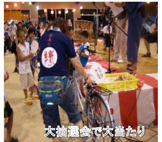
大抽選会で大当たり