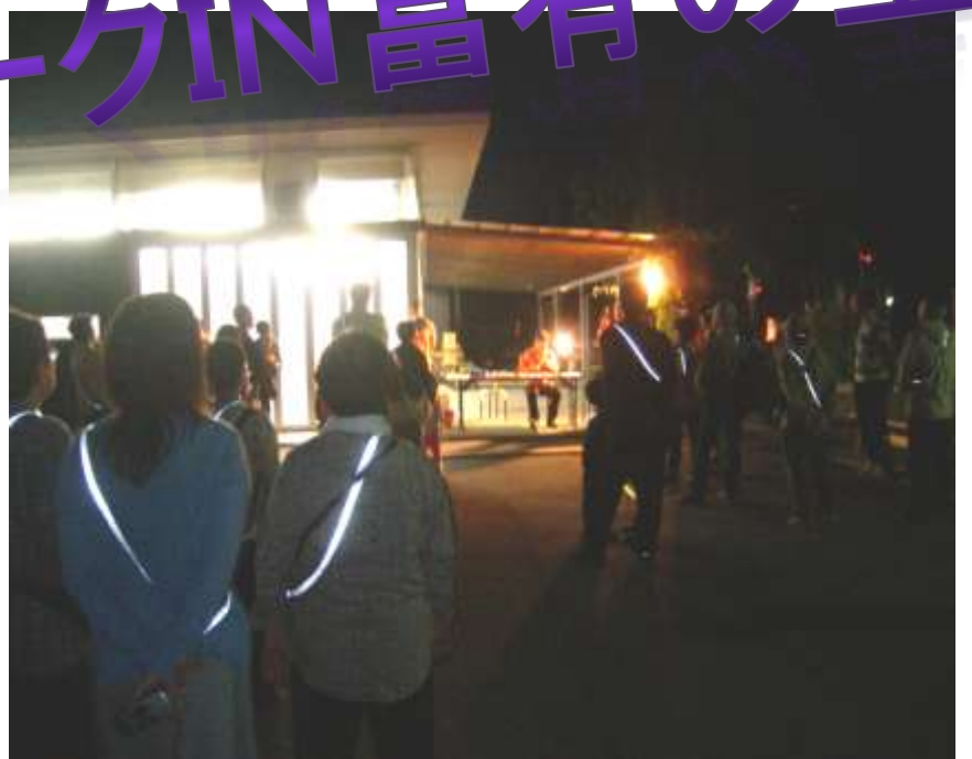
開会式(えぷろん広場)