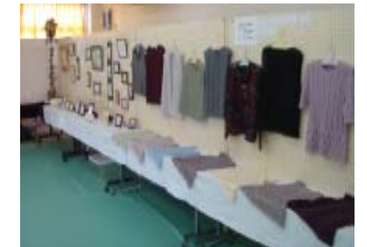
力作が並びました。 ～作品展示群～