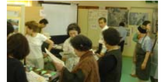
数値が気になる。 ～健康コーナー～