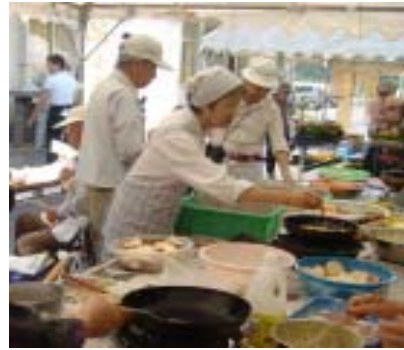
天ぷら裏方、もう大変！ ～釣り同好会～