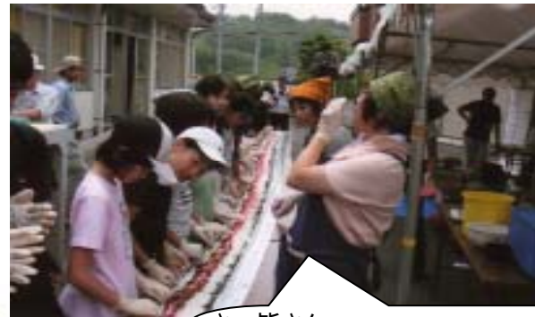
さー皆さん 一、二、三で巻きましょう！準備OKよ。 ～せーのーで、のり巻きづくり～