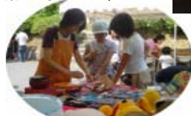
買うのも楽しい、売るのも楽しいバサーです。 ～フリーマーケット(子供会)～