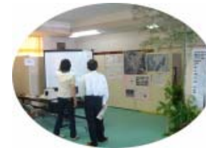
懐かしの秘蔵ビデオも登場。 ～東西町の歴史、振興協議会コーナー～