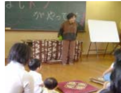
今年も、おはなしドンがやってきた。