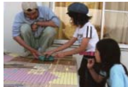
私の貼り付けたモザイク。ずーと残るんだよー。ていねいにしっかりと。 ～モザイクで作ろう町のサイン～