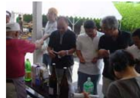
1級酒だとおもったにナー。料理酒でした・・・ ～利き酒選手権～