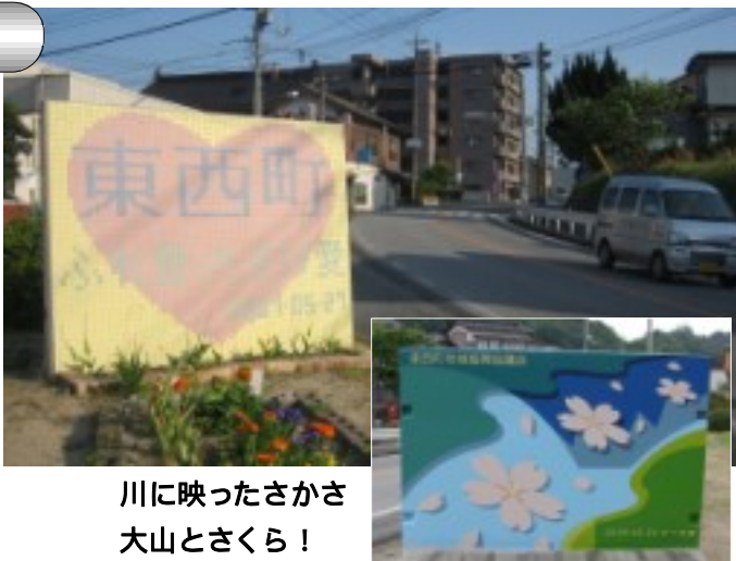
川に映ったさかさ 大山とさくら!