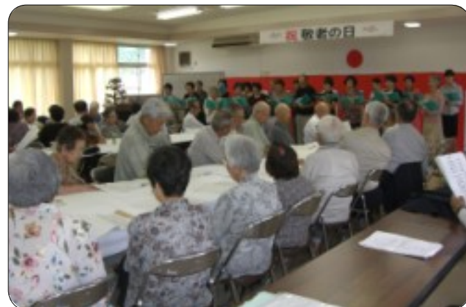
会場みんなで大合唱 ～うたの会～