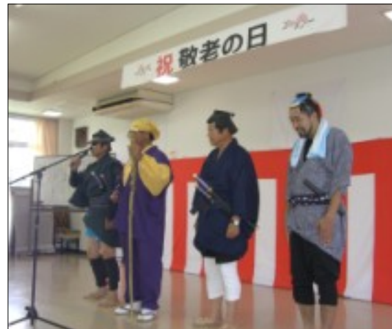
ご存知、水戸黄門一座