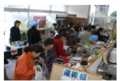
月回のわくわくショップ (つどい)

「商店の少なくなった東西町がすこしでも明るく元気になるよう頑張っています。いしょに参画していただけますか？お気軽にどうぞ。」