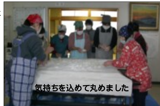
気持ちを込めて丸めました