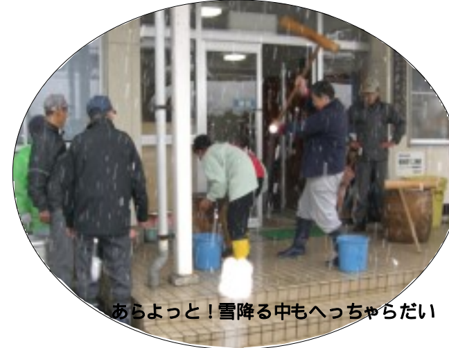
あらよっと!雪降る中もへっちゃらだい