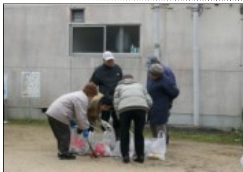
東西町万寿会による空き缶ごみ拾い活動(1月10日)