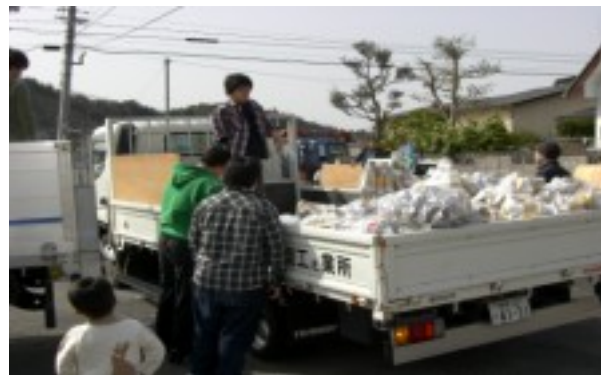
中学生も手伝ってくれました

南部町でも継続してリサイクルを行っているところが少ない中、毎月の町の回収があるのになぜ？という声もありますが、資源の大切さを学ぶこと、子ども達と共に汗を流すこと、高齢者の方々が集積場に持って出られるのが大変ではないかということも考え、年に3回行っていきます。人手が少なくなり大変ではありますが、先回は積み込みを手伝いに来ていただいた方も沢山おられ、助け合いの輪が広がったような気持ちでした。ちょっとした気持ちがとてもうれしく感じます。ご協力ありがとうございました。