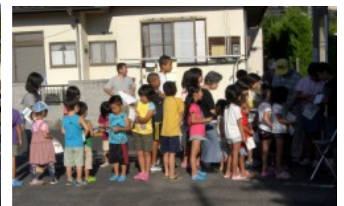
2区4班 新宝楽様付近 スタンプ押しの列