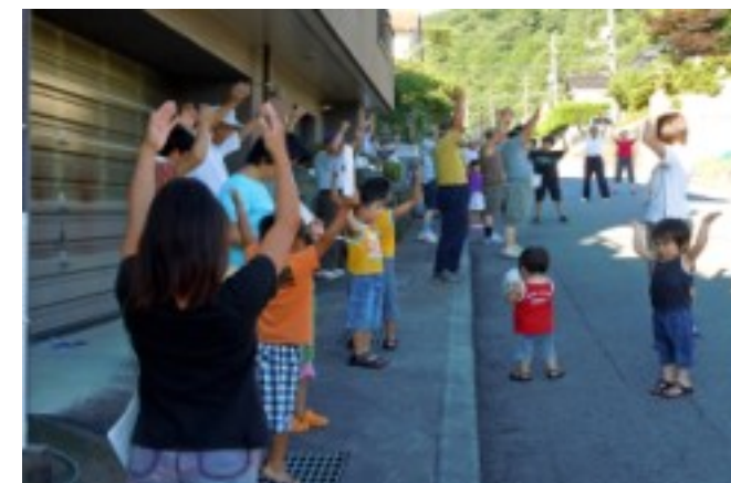
4区4班 第一設計様事務所付近