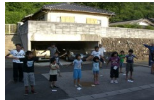
1区1班 荒木様宅付近

地区内3か所で、8月12日(木)まで、朝7時から、みんなでラジオ体操を行っています。 平成20年にNHK夏の全国巡回ラジオ体操が、花回廊で実施されたのを機会に、健康づくりや交流をはかろうと小学生のみならず大人も交じって行うことになったものです。 3か所にそれぞれお世話と見守りの方をお願いし、昨年を上回る参加者で盛り上がっています。東西町の新しい夏の風物詩になる予感がします。みなさんも是非参加下さい！！