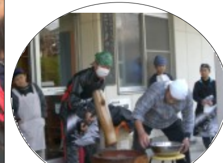
小、中生も、もちつきをしてくれました。