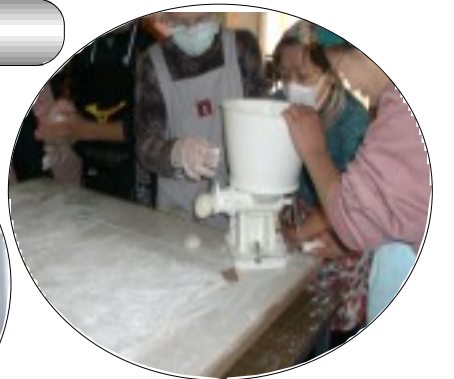
秘密兵器～もち切り器～で能率アップ