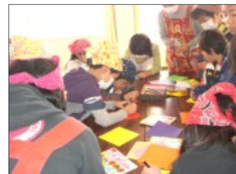
高齢・独居の方々に、子どもたちが心をこめて書いた手紙も添えて届けました。