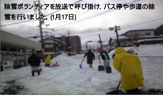
除雪ボランティアを放送で呼び掛け、バス停や歩道の除雪を行いました。(1月17日)