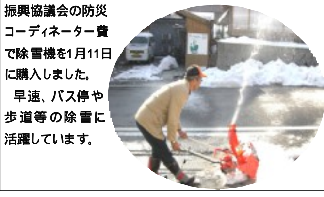
振興協議会の防災コーディネーター費で除雪機を1月11日に購入しました。早速、バス停や歩道等の除雪に活躍しています。