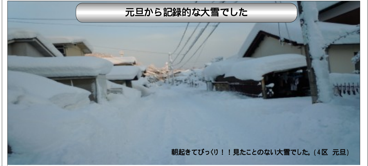
元旦から記録的な大雪でした