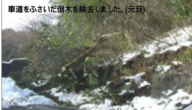
車道をふさいだ倒木を除去しました。(元旦)

正月の大雪により車庫の倒壊等の被害を受けられた方もいらっしゃったのではないのでしょうか。南部町の対応は近隣の市町村にはない早いもので、元旦から除雪車による雪かきがおこなわれましたが、路上駐車が多く除雪の妨げになっていたことが課題となりました。帰省者の為に正月時期に運動公園、コミュニティセンターの駐車場の開放等、今後対応策を考えていきたいと思ひます。一方、班員の方が総出で雪かきをされたり、ごみ集積場所やバス停を率先して雪かきされる方もおられ、大変な雪ではありましたが、助け合いの姿を見る事もできました。大変な時こそみんなで助け合って行きましょう。