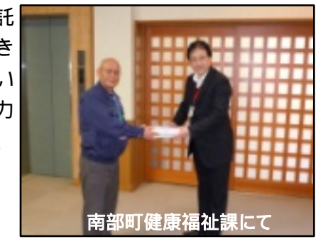
南部町健康福祉課にて

協議会事務所で受け付けをした義援金は、4月4日時点で、67名・2団体より、合計で255,678円集まりました。同日日本赤十字社鳥取県支部南部町分区へ寄託しました。引き続き受付していますのでご協力をお願いします。