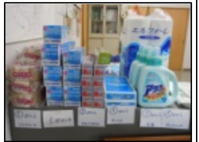
エコポイントの交換商品

日のさつき祭での利用が最後です。また、商品交換は5月31日(火)午後5時までに協議会事務所で交換してください。なお、引き続きプラ類やざつがみ等の分別をお願いします。