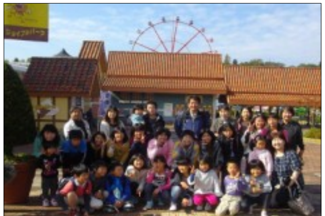
大人も子どももみ～んないい顔