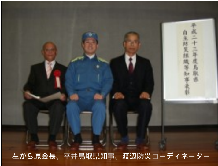
左から原会長、平井鳥取県知事、渡辺防災コーディネーター