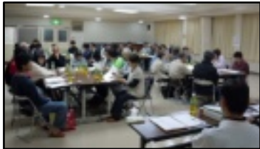
新理事・班長会議

4月22日、今年度、区のまとめ役をお願いします区長、町づくり部員としてお世話いただきます理事、そして班の取りまとめ役の班長さん方にお集まりいただきました。それぞれの業務内容を資料に基づいて説明させていただきました。特に今年度から理事さんには、消火栓器具箱内のノズルなどの盗難があった事を踏まえ、消火栓器具箱の月2回の点検を新たにお願いするようになりました。この1年間、どうぞよろしくをお願いします。