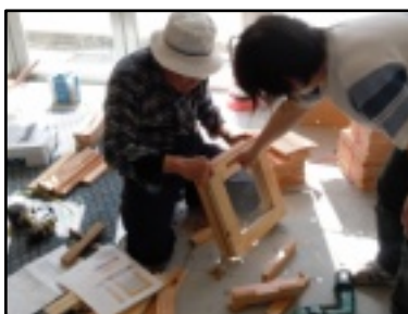
巣箱づくりの様子