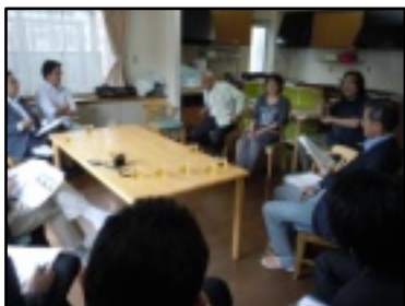
活発な質問をする視察参加者