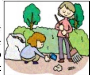
子どもはちゃんと見ています

さ～実践しましょう！クリーン運動 今年度から、ふるまい向上運動として全町挙げて取り組みます「おせの背中を魅せよう」として、東西町では「東西町ピカピカ運動 ～空きかん ごみ拾いで心もクリーンに～」を展開します。このモデルは長年にわたり万寿会の皆さんが取り組まれている「空き缶・ごみ拾い」です。今後は地区の方全員で地区内の「～空きかん ごみ拾い～」を常時実施し、東西町からポイ捨てごみを一掃するとともに、将来を背負う子ども達におせ(大人)がお手本を示してまいりたいと思います。