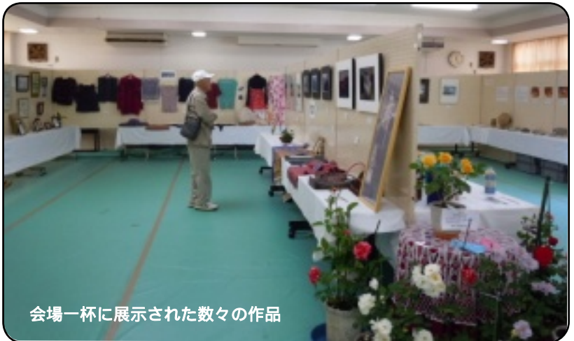
会場一杯に展示された数々の作品

前日の準備は午後1時から実行委員が集合し、展示室のパネルの組み立ても慣れた手つきでどんどん進んでいきます。3時になると出展される団体の方々が会議で決められた場所に作品を展示されます。以前は作品を集めるのに苦労しましたが、教え・学びネットワークによりたくさんの作品が並びました。また、中学校との連携で地域の中学生の作品や、昨年に続き境矢石遺跡出土品も展示されました。