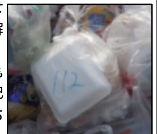
ほとんどのごみに記入がしてあります

先月も誤って出されたものが残っていましたが、記入がしてあったため、立ち当番さんの対応も容易になりました。