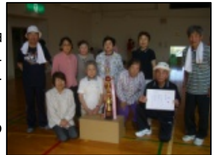
東西町精鋭の選手のみなさん