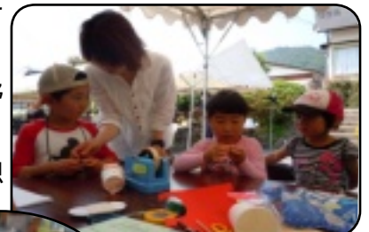
紙でつくるおもちゃ トコトコに夢中

今後も、教え・学びの絆をさらに深めて町づくりに取り組みたいとの想いを強くした「さつき祭」でした。