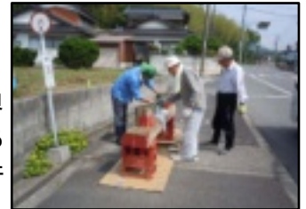
赤からグリーンへ