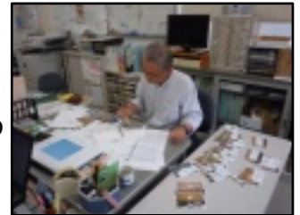
写真郵送の作業中です