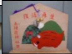
協議会事務所内入口に飾っています