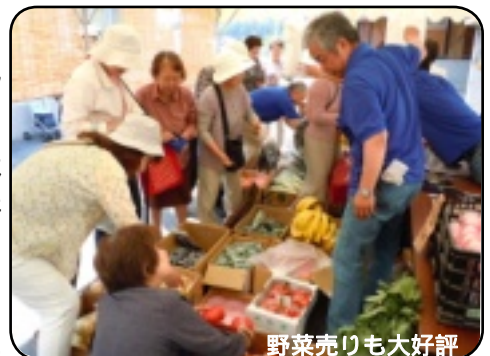
野菜売りも大好評

今年も同好会等による屋台が軒を並べました。チビッコ達は、体験チャレンジコーナーで大いに楽しんでいました。毎年大好評の杵つき草餅は、例年より義援金分として50円の加算となりましたが、次々とつきあがるも、すぐに売り切れとなっていました。