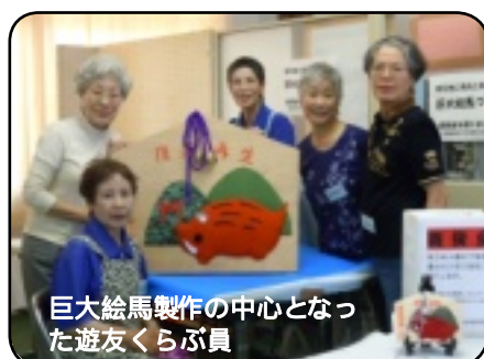
巨大絵馬製作の中心となった遊友くらぶ員