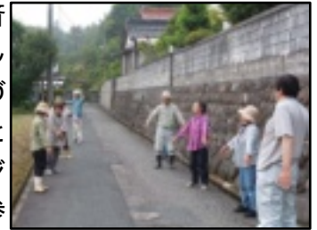
4区1班ラジオ体操風景

6月3日に春の一斉清掃が無事終了いたしました。きれいな町づくりにご協力ありがとうございました。ラジオ体操も314名の方に参加いただきました。