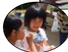
シャボン玉 上手くできたかな

さつき祭でのプラ板ストラップの参加料に一部誤りがあったようです。申し訳ありませんでした。多くいただいた参加料1,350円は義援金とさせていただきますとおもいます。