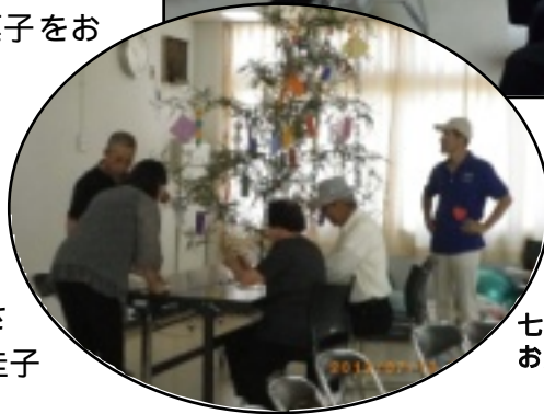
七夕飾りのたんざくにご利用するのは・・・