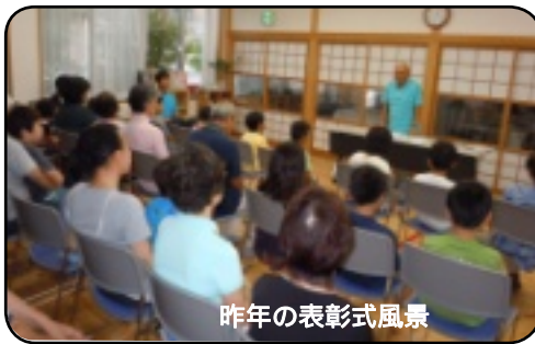
昨年の表彰式風景