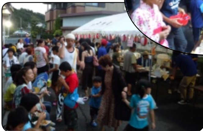
あちこちでふれ合う姿が見られました