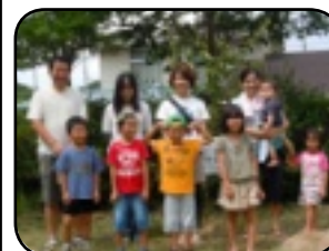
同日、小学1年生と保護者で記念植樹を行いました