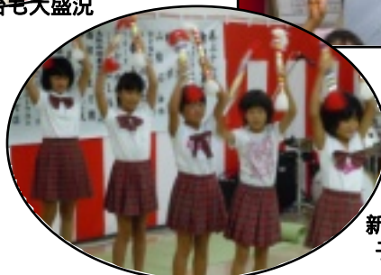
新調した衣装の 子ども銭太鼓