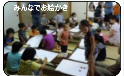
みんなでお絵かき

3時に集合して先ずは夕食のカレー作り。高校生の強力な応援もあり、小学生も懸命にジャガイモの皮むきや、玉ねぎを刻んだりしました。カレーを煮込んでいる時間はお絵かきタイムで、海や花火などの夏の思い出を描き終えると、ザリガニ釣りに出かけました。その収穫は川エビ僅か1匹。夕食を食べた後はゲームや卓球を楽しみ、暗くなってからは、運動公園での花火をしました。