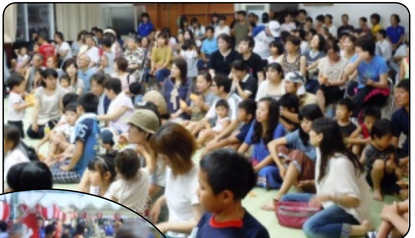
さ～ いよいよとみくじ抽選会です