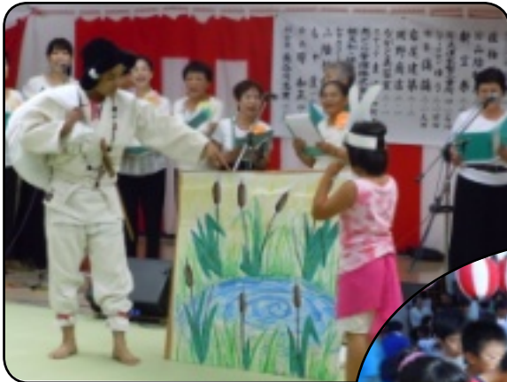
歌に合わせた因幡の白ウサギ「うたの会」

踊りや花火は取り止めになり残念でしたが、狭い場所だったから、いろいろな人と話ができればいいのできた夏祭りになったのではないのでしょうか。ご来場いただきました皆様、ご協力いただきました役員の方々ありがとうございました。義援金1,966円をお預かりしました。