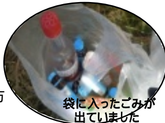
袋に入ったごみが 出ていました

11月25日(日)リサイク ルを行いました。たくさ んの子ども達と一緒に資 源の回収をしました。