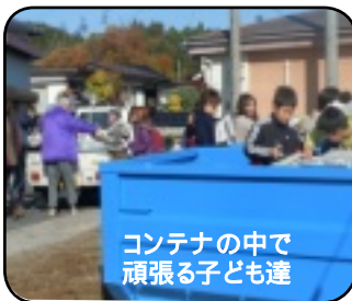
コンテナの中で 頑張る子ども達

11月25日(日)リサイク ルを行いました。たくさ んの子ども達と一緒に資 源の回収をしました。