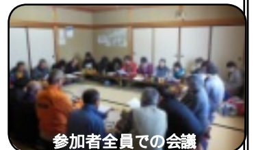
参加者全員での会議