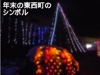
年末の東西町のシンボル