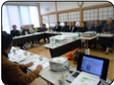
活発な質問で予定時間をオーバー

倉吉市高城地区社 協から来られ、東西 町が取り組んでいる 高齢者の見守りや支 えあい体制の仕組み などについて説明を 行いました。