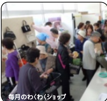
毎月のわくわくショップ

平日の災害対応も考えて、12月19日(水)の午後1 時30分から安否確認協力委員懇談会を開催しまし た。防災ワークショップで出た質問の回答の確認や避難 経路の見直し、防災倉庫の設置場所、委員の集合 場所などの話し合いを行なっていただきました。