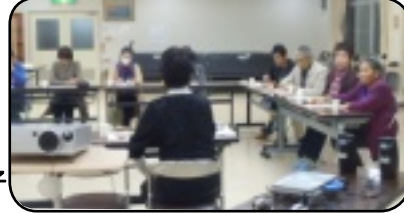
人権茶話会の様子