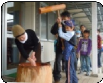
頑張ってもちつきをしました

初めて訪問するお宅に緊張していた子ども達でしたが、温かい言葉をかけてもらい、顔もほころんで帰ってきました。