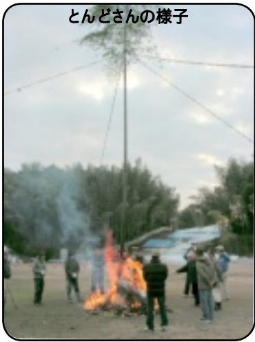
とんどさんの様子

今年の『恵方』の南南東にしんぼこ(竹)を倒して無事終了しました。今後は子どもたちも楽しんで参加できる『とんどさん』を企画したいと思っています。