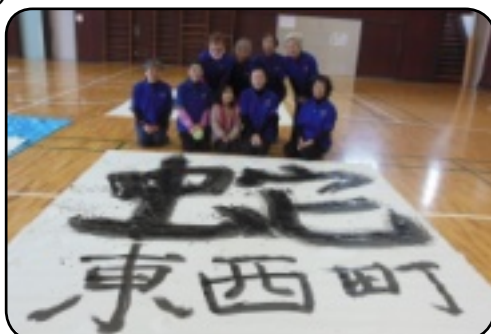
1画づつリレーして書きました