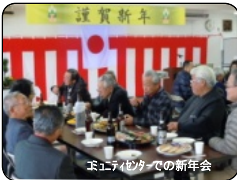
コミュニティセンターでの新年会