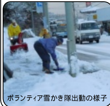
ボランティア雪かき隊出動の様子

1月18日に今季初めての出動で、地区内の歩道を2時間ばかりで除雪していただきました。「腰は痛いけど、たくさん