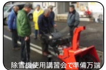
除雪機使用講習会で準備万端

昨年の12月26日は、まだ雪の無い時でしたがボランティア雪かき隊の方々8名が講習会に参加されました。地区内の歩道に15センチ以上の積雪時の出動に準備万端。