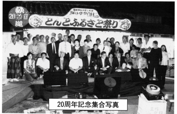
20周年記念集合写真