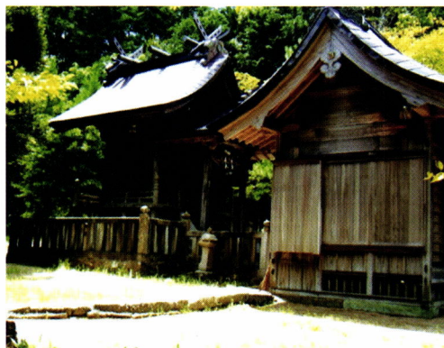
糺 神 社