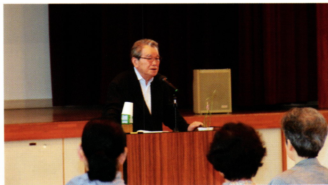
「イザナミ墓苑の閃き」と題して 講演される新納理事長 (ふるさと交流センター)