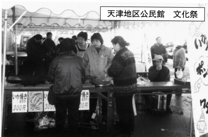
天津地区公民館 文化祭

在任中多くの人々から、豊富な話題・ご協力・励まし・元気を頂き「であい」「ふれあい」の日々に恵まれた十年間でした。