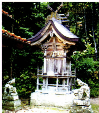
鷺 神 社

たのが明治二十三年九月、左にあったのが明治二十四年五月と刻されていました。また、旧法勝寺電车道をはさんで御神燈から二十メートルほどの位置に鳥居もありました。宝暦三乙亥年(一七五三年)六月と刻されていました。しかし、平成十二年にあった鳥取西部地震によりすべて倒れてしまい、現在は新しい燈籠のみが立てられています。(渡邊 悦朗)