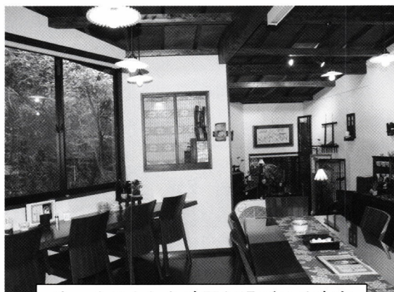
ゆっくりとした時間が過ごせる店内