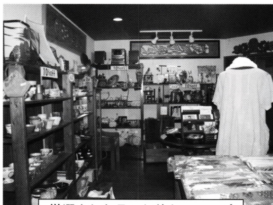
厳選された品々が並ぶショップ