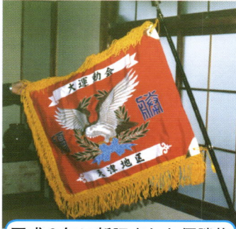
平成2年に新調された優勝旗