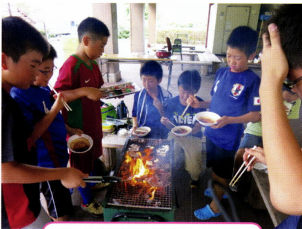
さすが6年生ありがとう！

出来上がったソーセージを蒸していただいている間にバーベキューをしました。野菜を切ったり、おにぎりを握ったり全て子ども達で準備してもらいました。色々な形のおにぎりがありませんが、おにぎり給食で慣れたものであったという間に出来上