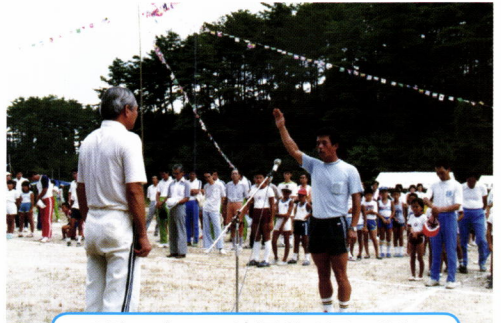
昭和59年 天津運動公園で開催