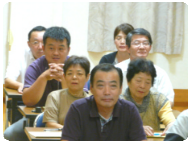
参加者の方の感想です。

おしっこのお話を聞くことが少ない分タメになりました。今後も健康講座を続けて下さい。