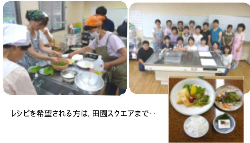
レシピを希望される方は、田園スクエアまで・・・

いつもと違った料理で美味しかった。家ですぐ作れそうなので作ってみようと思います。長いもの寒天はおしゃれで美味しかったです。