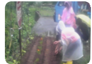
花の苗植え作業 猪小路区

朝顔の苗を各集落に配っています。今号が出る頃には配布した苗も大きくなり緑のカーテンが出来る頃かと思えます。