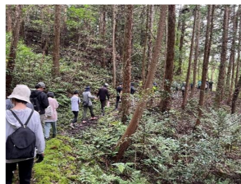
古道を通って清水井へ