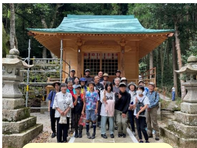
遷宮を迎えた 赤猪岩神社の前で集合写真♪