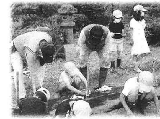
【5年生総合的な学習：田植え体験】