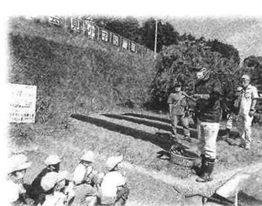
【3年生総合的な学習：柿の摘蕾体験】